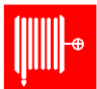
Manguera para incendios