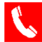
Teléfono para la lucha contra incendios