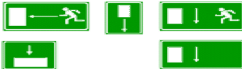
Salida o salida de socorro.