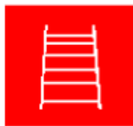
Escalera de mano