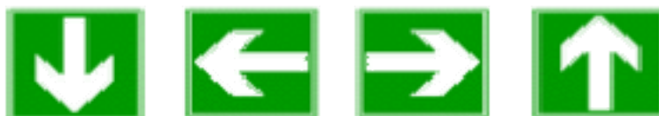
El reción que debe seguirse (señal indicativa adicional a las siguientes)